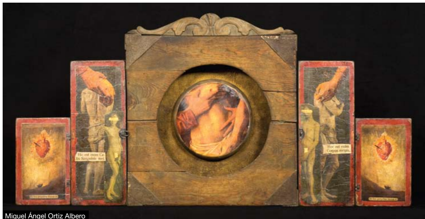
Miguel Ángel Ortiz Albero

Desde 1970 compone bandas sonoras para películas. También realiza diversos cortometrajes y un episodio de la serie "Delirios de Amor" para TVE. En 2001, dibuja, escribe y realiza su primer largometraje Un perro llamado Dolor que es seleccionado para diversos festivales de cine: San Sebastián (España), La Habana (Cuba),