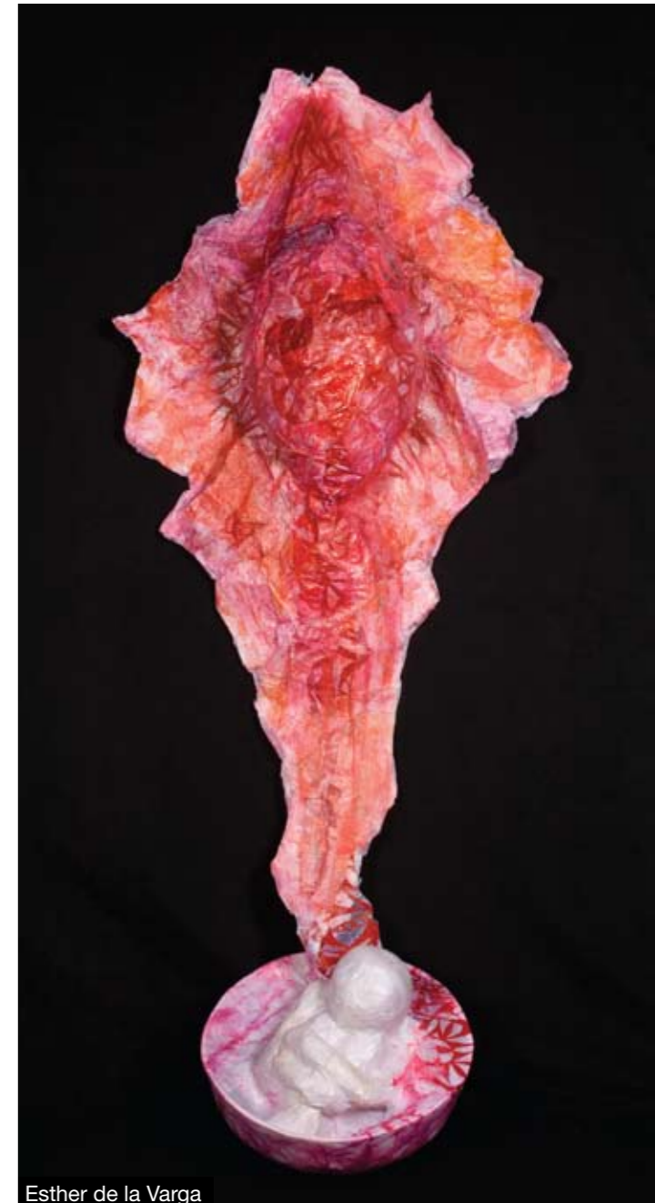
Esther de la Varga